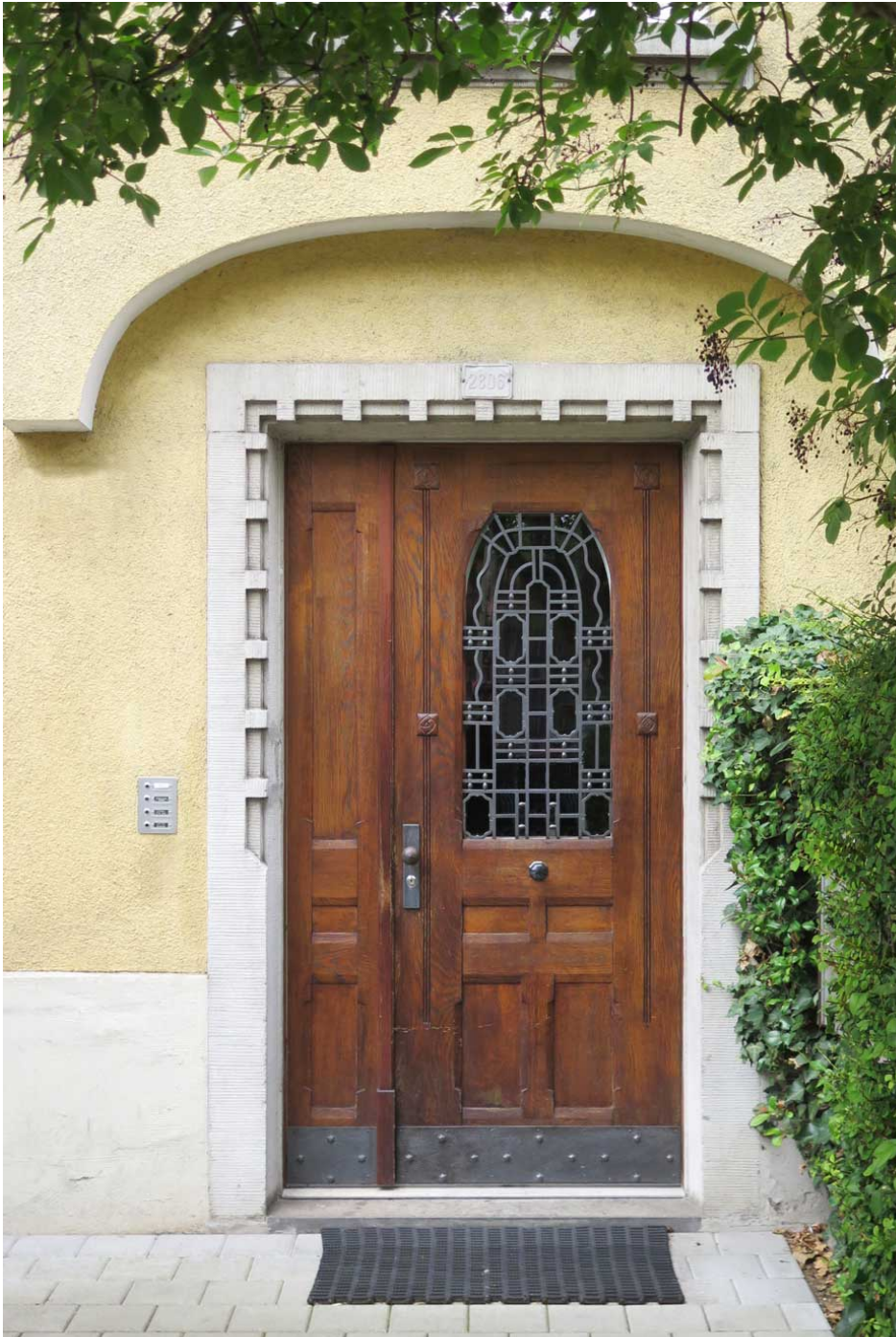
Geiselweidstrasse Architecte: inconnu Date de construction: inconnue