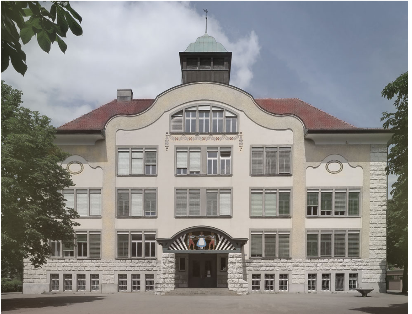
Schulhaus Wülflingerstrasse Architectes: Rittmeyer & Furrer Date de construction: 1905