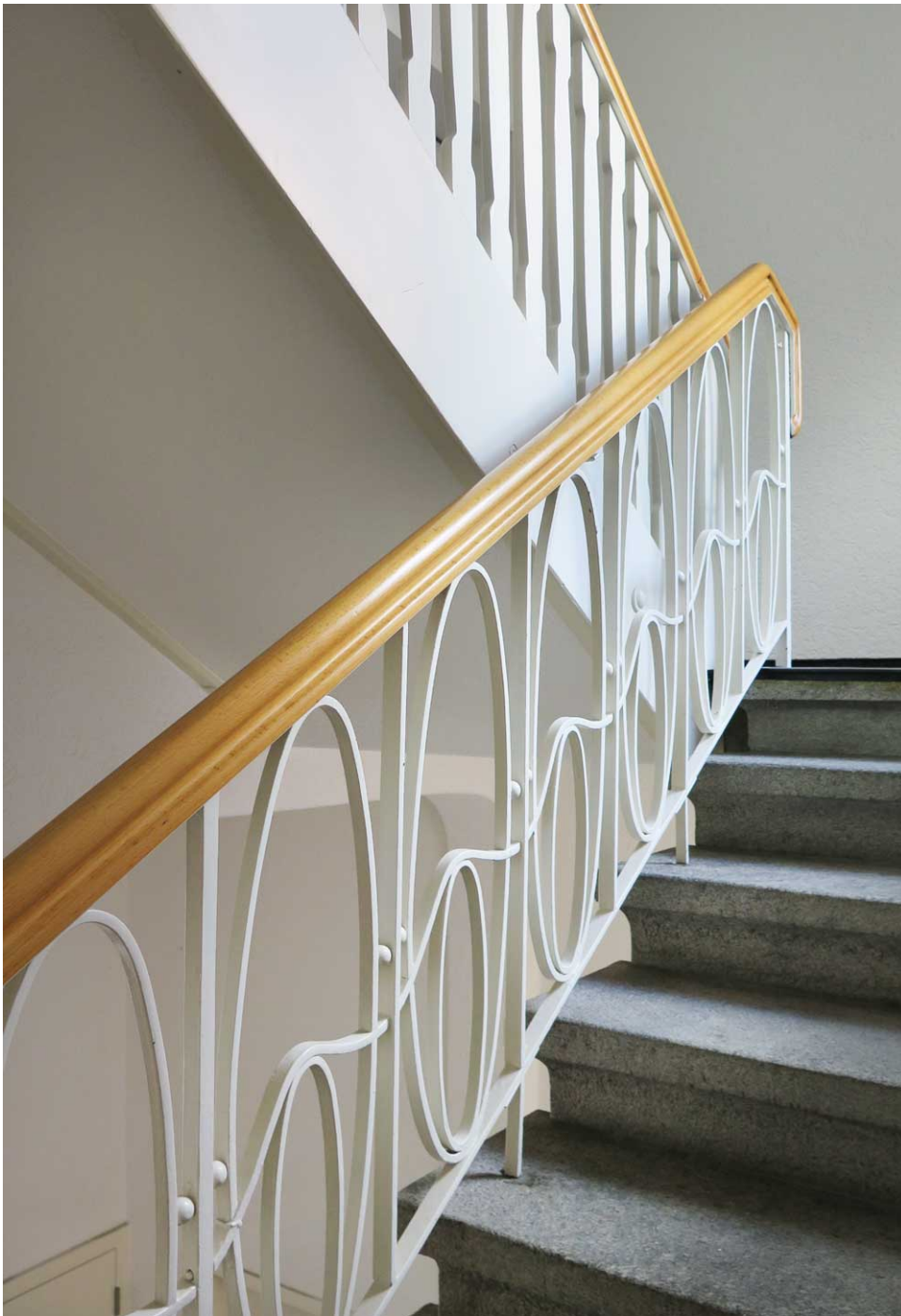
'Das hohe Haus', Bankstrasse Architectes: Rittmeyer & Furrer Date de construction: 1905/1906