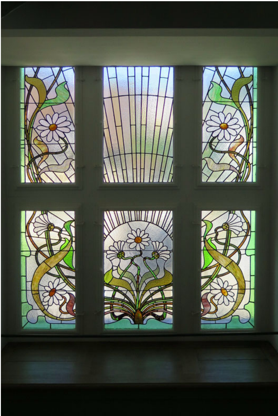
Paulstrasse Architectes: Jung & Bridler Date de construction: 1898