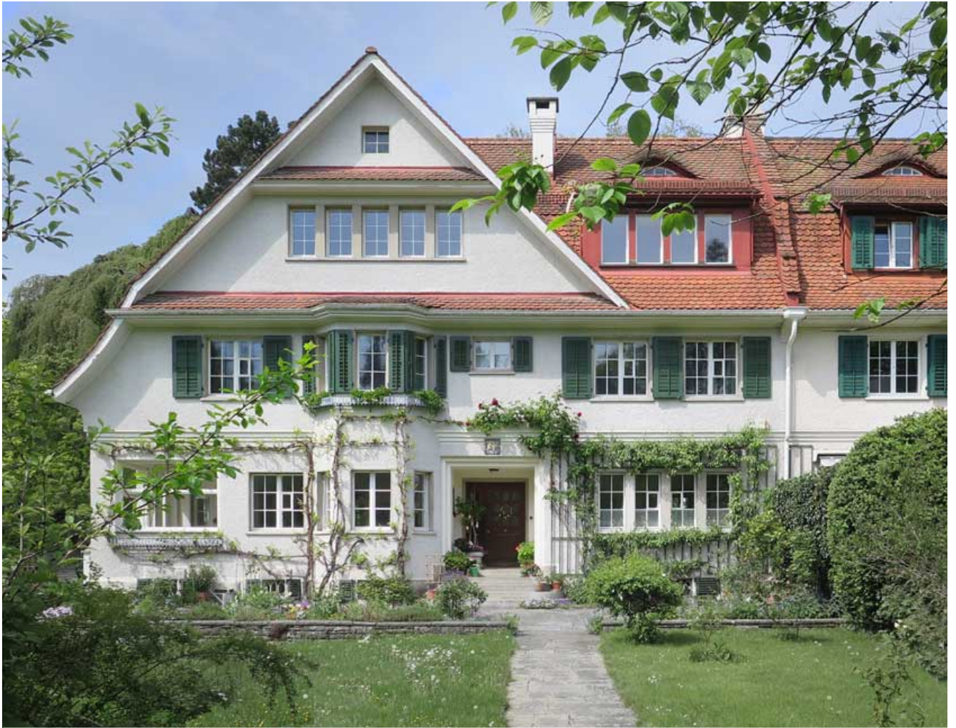
Seidenstrasse Architectes: Rittmeyer & Furrer Date de construction: 1908