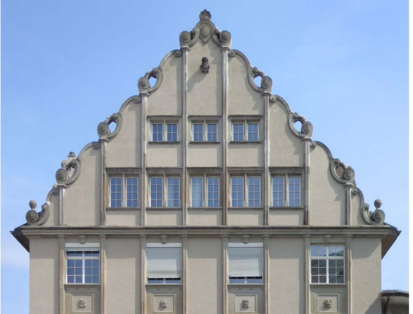
Meisenstrasse/Technikumstrasse Architectes: Bridler & Völki Date de construction: 1916-1917